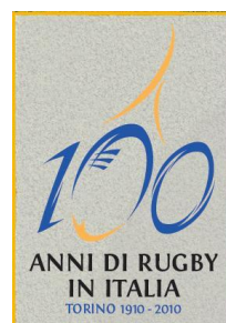
Logo 100 ANNI DI RUGBY IN ITALIA TORINO 1910 - 2010

Per tradizione il Torneo della TORRE ospita anche formazioni estere oltre a quelle nazionali e si avvale del sostegno di quanti possono contribuire in forma economica alla buona riuscita della manifestazione, a questo proposito viene intitolato un Trofeo messo in palio dal sostenitore patrocinante.