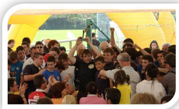
un momento della premiazione

Il Torneo della TORRE è cadenzato da orari e tempi di esecuzione predefiniti dal gruppo organizzatore e gli arbitraggi sono eseguiti da arbitri e/o proposti dalle società che insieme ai tecnici prendono conoscenza del regolamento all'accettazione dell'iscrizione. Alle società partecipanti vengono forniti il programma della manifestazione e il necessario supporto informativo relativo alla loro trasferta e al soggiorno.