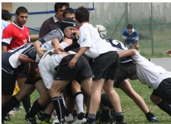
giocatori in azione

La manifestazione si completa con la premiazione delle squadre e la consegna dei trofei e degli attestati di partecipazione tramite i Presidenti delle società SETTIMO RUGBY Junior e VII° RUGBY TORINO, il segretario del Comitato organizzatore che insieme allo Sponsor patrocinante e alle Autorità cittadine consacrano questo torneo all'insegna del rugby e della convivialità.