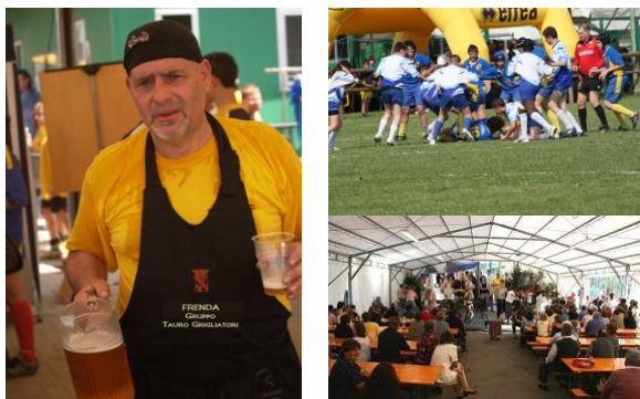
Momenti della festa

La Festa Giallo-Azzurra è il momento dove le nostre società esprimono il loro più alto momento di aggregazione e amicizia fra i propri tesserati, sostenitori e simpatizzanti.